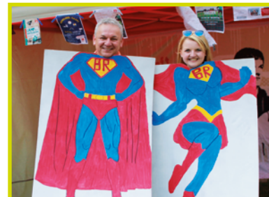
Entdecke auch Du den Superbetriebsrat in Dir!

Der Dialog und die Vernetzung mit anderen Betriebsräten aus der Region stehen im Vordergrund. Nutz die Chance für Dich, Dein Gremium und Deine Belegschaft. Werde Teil des Netzwerkes Bildung vor Ort!