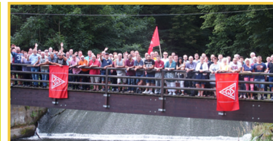
Das Netzwerk der IG Metall – ein starkes Team!