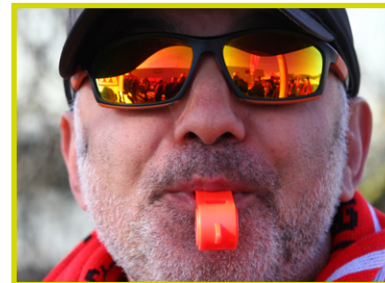
Die IG Metall Ostoberfranken präsentiert: Bildung vor Ort!

Der Dialog und die Vernetzung mit anderen Betriebsräten aus der Region stehen im Vordergrund. Nutz die Chance für Dich, Dein Gremium und Deine Belegschaft. Werde Teil des Netzwerkes Bildung vor Ort!