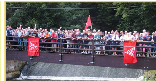
Das Netzwerk der IG Metall – ein starkes Team!